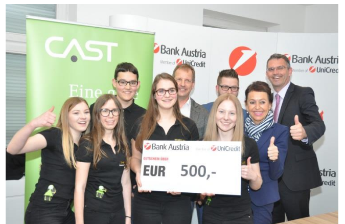
3. Platz: „The Littles“ (Prof. Pointecker), HBLW Ried i. I., OÖ