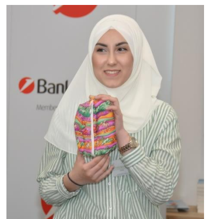
Sehr überzeugend ... „Elevator Pitch“ mit Anschauungsmaterial