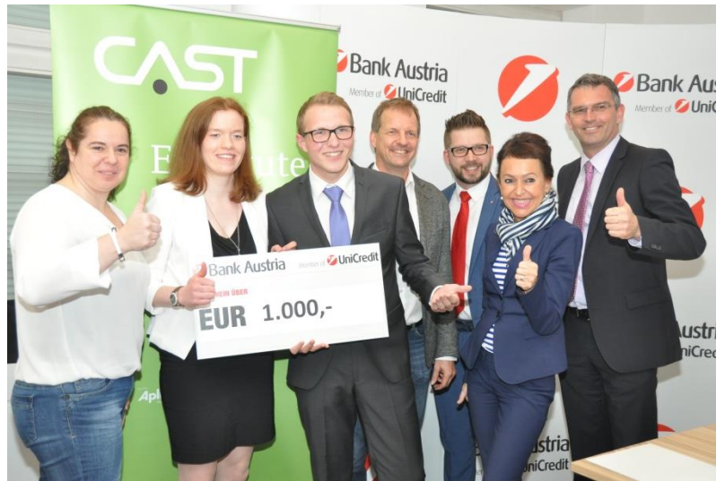
1. Platz: „Lagerregal“ (Prof. Braunstorfer), BHAK Baden, NÖ