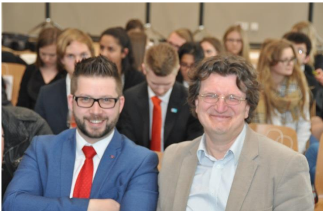
Die Partner sichtlich gut gelaunt ...